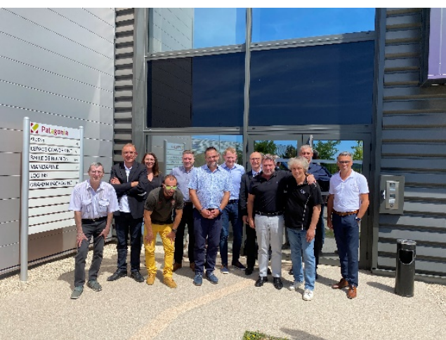
Dirigeants et équipe de Graham Packaging lors de l'inauguration des nouveaux locaux au Patagonia

GRAHAM PACKAGING a emménagé début mai 2022 au Patagonia dans 110 m 2 de bureaux reconfigurés pour accueillir les six membres de l'équipe. L'entreprise est spécialisée dans la fabrication de contenants sur mesure à partir de granules de plastique. De nombreux objets de consommation du quotidien, issus par exemple du secteur alimentaire ou pharmaceutique, font appel aux pots, bidons, et autres solutions d'emballages proposées par la société. Celle-ci accompagne ses clients dans la recherche du package le mieux adapté à son projet et à son produit.