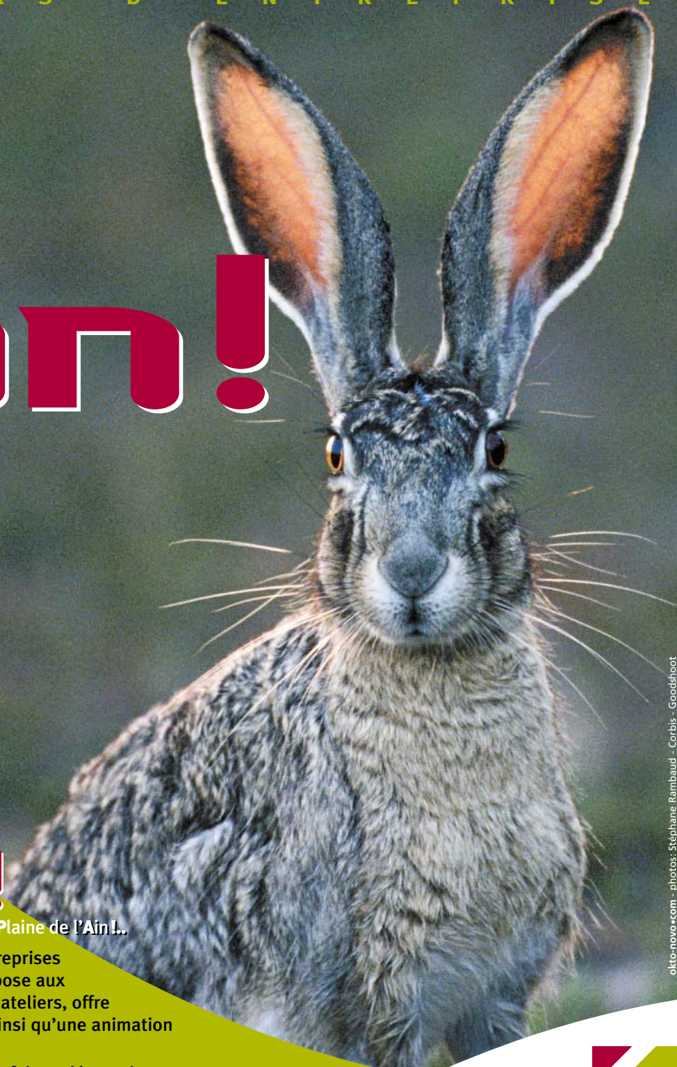
okto-novo.com - photos: Stéphane Rambaud - Corbis - Goodshoot